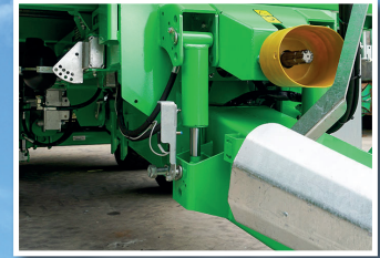
Hydraulische Federung der Deichsel und der Achsen