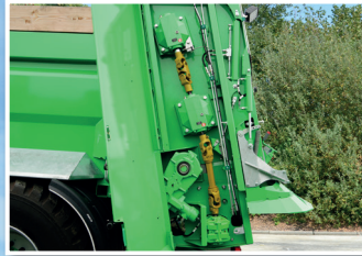
Antrieb über Getriebe und Kardanwelle