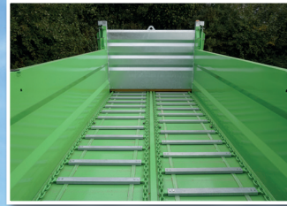
Doppelter Transportboden mit verschraubten Leisten und Schiffsketten Klasse 80