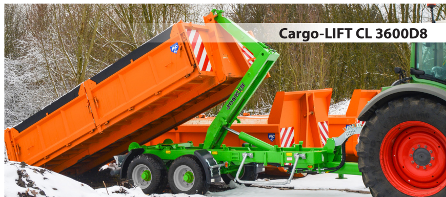
Cargo-LIFT CL 3600D8