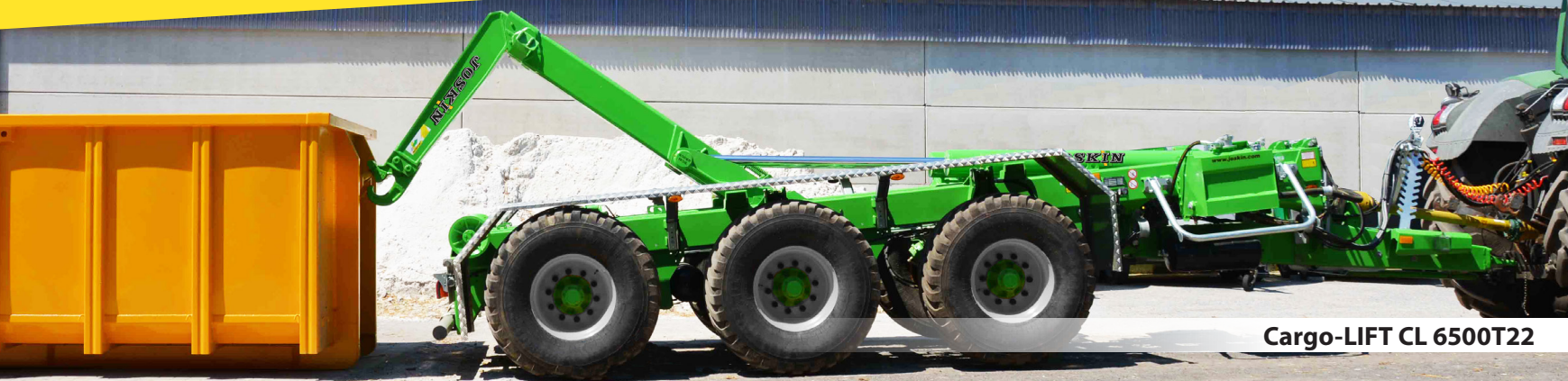
Cargo-LIFT CL 6500T2

ДОРОЖНО-СТРОИТЕЛЬНАЯ ТЕХНИКА ЛИНЕЙКИ ДЛЯ САМЫХ ТЯЖЕЛЫХ РАБОТ!