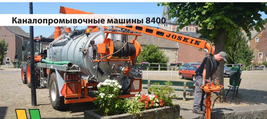
Каналопромывочные машины 8400