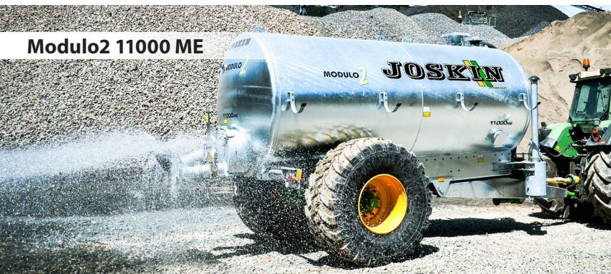
Modulo2 11000 ME