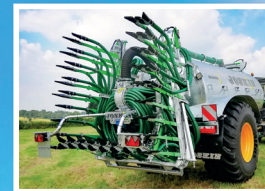
Kompaktowe wymiary po podwójnym złożeniu z tyłu wozu